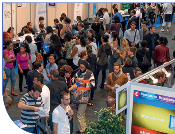
Rencontres & Recrutements (2014), à Toulouse

Etudiants en fin de cursus, visiteurs qui souhaitent se reconvertir, porteurs de projets qui aimeraient créer une entreprise, c'est l'occasion de prendre de l'information et de se faire conseiller.