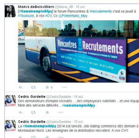
Exemples de tweets en 2014...